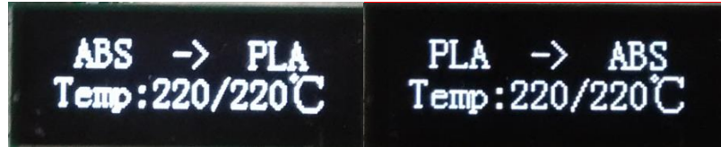
Рис. Смена PLA пластика на ABS

Данное оборудование позволяет производить интеллектуально замену материалов благодаря встроенной программы оптимизации, данная итерация не вызовет у пользователя особых трудностей, достаточно нажать только одну кнопку для замены пластика.