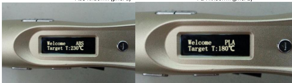
PLA пластик (рис. 2)

При включении оборудования экран будет показывать, какой вид пластика вы использовали в прошлый раз, как на рис. 1 или рис. 2. После этого вы можете путем нажатия на кнопку “speed controller” («регулятор скорости») выбирать между материалами. Когда на экране надпись PLA, значит, 3D ручка находится в режиме печати PLA пластиком, тоже самое и для ABS пластика. «target T» означает заданную температуру для данной печати, Вы можете установить температуру с помощью кнопки регулировки температуры.