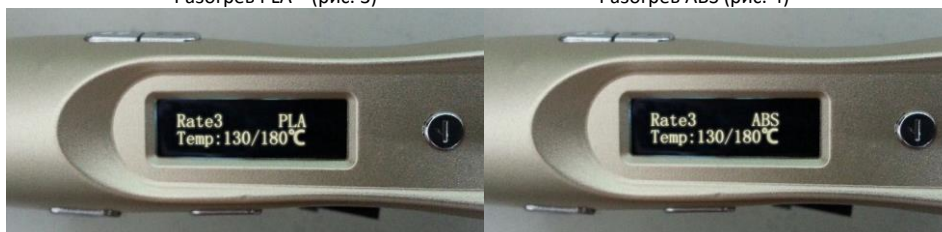
Разогрев ABS (рис. 4)

После выбора материала и температуры печати, оборудование переходит в режим разогрева до нужной температуры. Рис. 3 показывает разогрев на условиях печати PLA пластиком, рис. 4 для ABS пластика. «Rate3» означает текущую скорость, в нашем случае – 3, материал который мы будем использовать для печати ABS/PLA, температура текущая и температура заданная.