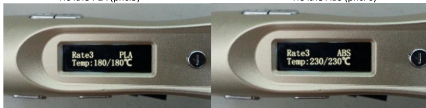
Печать ABS (рис. 6)

Как только текущая температура достигнет заданной температуры, оборудование готово к работе. Интерфейс управления такой же, как при разогреве ручки. Загрузите нить в отверстие для подачи и нажмите кнопку «wire», встроенный механизм захватит нить, когда расплавленная нить выйдет из сопла – загрузка прошла успешно (необходимо обеспечить легкий заход нити).